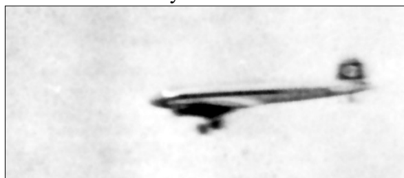
Nærbillede af tysk fly af typen Focke Wulf FW-200 Condor over Gravlevdalen

De nordgående fly blev ved med at flyve meget lavt. Mange fløj så lavt over engen og op gennem dalen i kohegnet, at vi fra møddingen tydeligt kunne se mandskabet i maskinerne og de hagekors, der var malet oven på vingerne. At der ikke skete flere ulykker ved den hasarderede flyvning kunne nok undre, men der styrtede dog én ned lidt øst for Støvring station. Hele besætningen omkom. En anden måtte nødlande oppe ved Borupgårde, hvor den fik den ene vinge revet af mod en højspændingsmast, men her overlevede besætningen. Først hen mod aften begyndte de første enheder af den tyske hær at køre nordpå ad hovedlandevejen.