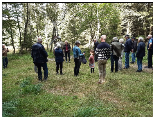
Det blev afholdt tur til Flyverstenen og et foredrag om Suldrup før og nu.