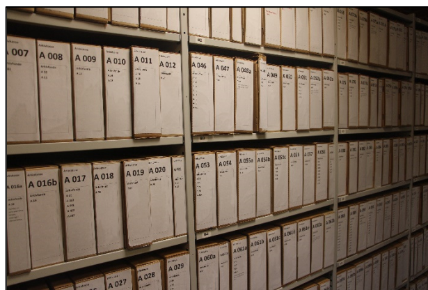
Arkivalierne opbevares brandsikkert i arkivæsker af syrefri karton