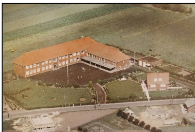
Det var på et loftet over pedelboligen i fløjen til højre, Arkivet holdt til de første år