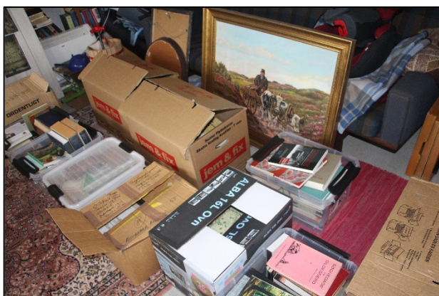
En større indlevering klar til sortering, registrering og arkivering