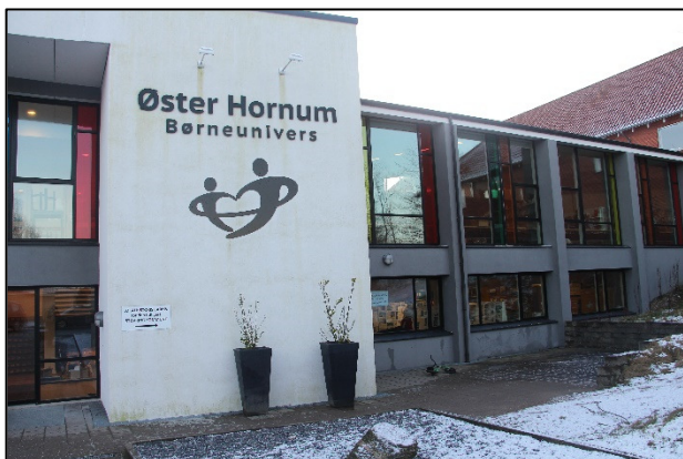
Arkivet har egen indgang til højre for Børneuniversets indgang

Ved dannelsen af Rebild Kommune dannedes Arkivsamvirket, hvor arkiverne i Skørping, Nørager, Haverslev, Rørbæk og Ravnkilde arbejder tættere sammen.