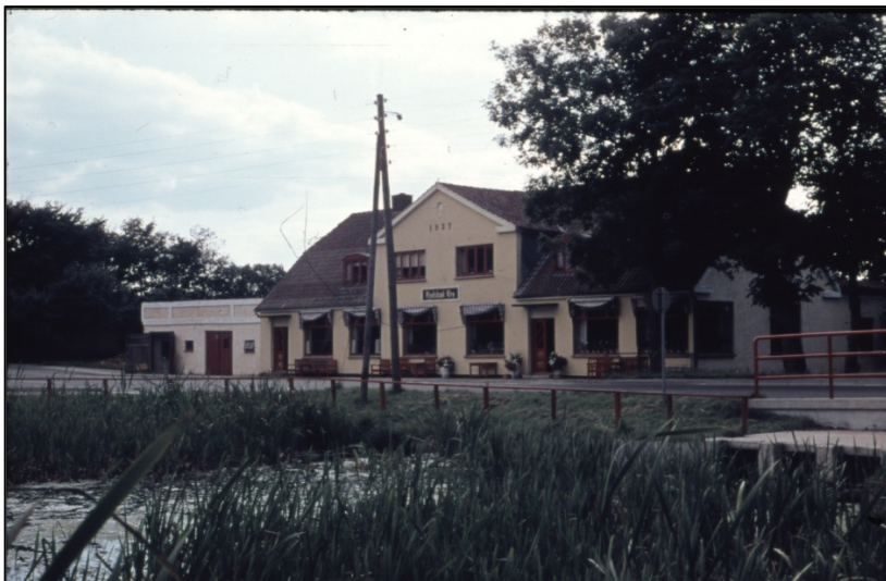
Hjedsbæk Kro, foto 1965

Artiklen er samlet og redigeret af Niels Nørgaard Nielsen