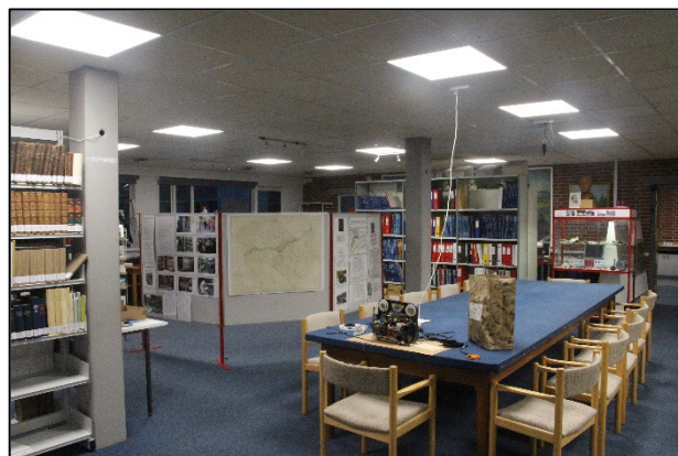
Et kig ud over Arkivets læsesal