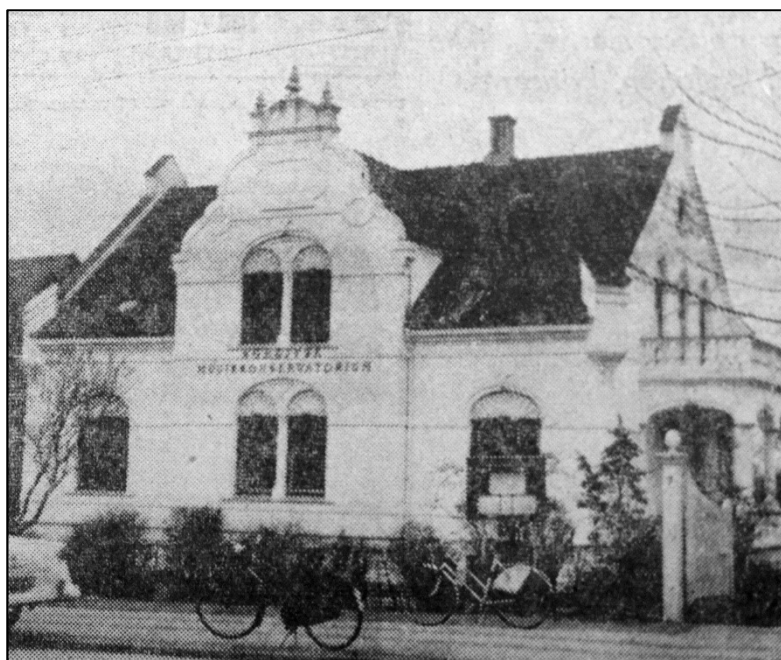
Det Nordjyske Musikonservatorium på Hobrovej i Aalborg