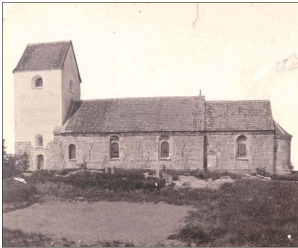
Veggerby kirke ca. 1900