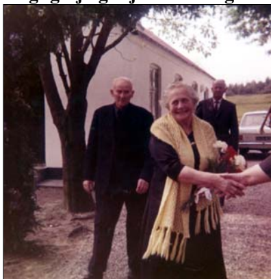
Guldbryllup i "stadsen"

nakken på vedkommende osv." Et udtryk som "moderne" blev han aldrig fortrolig med, ja ligefrem latterliggjort i hans ører blev det. For ham var det vigtigste ved en skjorte, at den ikke snærede i halssenen, et par bukser som kunne "nå om" eller et par sko som ikke klemte tærerne. Om det så havde været moderne i snit og form for halvtreds år siden, var ham komplet ligegyldigt.