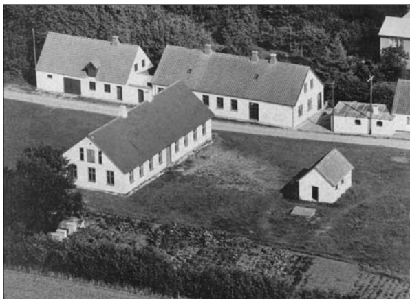
Øster Hornum skole set fra vest

Når man oppe fra kirken er kommet ned ad den stejle trappe med de mange trin og går videre hen mod den gamle skole, da begynder minderne at vælde frem. Årsagen her til er sikkert mest den, at alt står så godt som urørt fra hin forårsdag i 1933, da jeg for sidste gang stak penalhuset i bukselommen og med nogle gamle regnehæfter og stilebøger med mere trådte ud på den endnu liggende blankslidte trappesten, og med blandede følelse begav mig på hjemvejen. Måske er det sket enkelte gange, at en lille tåre er piblet i øjenkrogene, når jeg standsede lidt op ved den føromtalte trappesten. Vender man blikket om mod legepladsen, mangler her kun ”det lille hus”, som det hed i dagligtale, når man skulle bede om at gå på WC. Det var indrettet i to afdelinger for henholdsvis drenge og piger. Her var det en almindelig morskab at se, hvem der kunne tisse så højt, at vandet kunne pladre helt op i vinduet, som sad lidt højt. Denne spøg gav for øvrigt ofte lejlighed til et par lussinger til den formastelige, som fandt på den slags kunster, hvis det opdagedes.