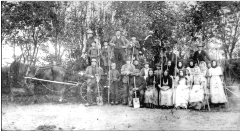
Folk på Mosbæks planteskole 1901

vi ville skræmme harene bort. Nå, vi kneb en gang imellem ind i den varme stue. Der var altid en af eleverne, der ville holde os ved selskab, så spillede vi seksogtres, og så ud at jage harene bort.