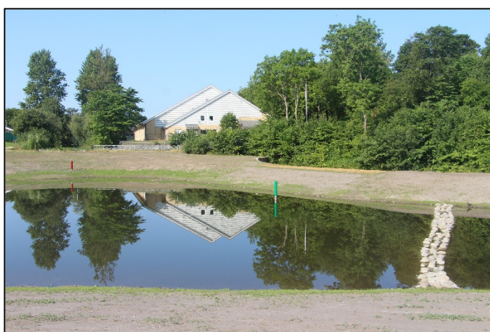
Regnvandsbassinet med Støvring Multihus i baggrunden. Den røde pæl markerer, hvor hammerværket lå, den grønne kornmøllen

Landbrugsdelen af virksomheden blev af mindre og mindre betydning og blev på samme tid endegyldigt afviklet og skilt fra til en selvstændig ejendom kaldet Møllegården, mens kornmøllen og maskinfabrikken fortsatte. Landbrugs-krisen i begyndelsen af 1930'erne medførte dog på grund af for lille omsætning, at maskinfabrikken lukkede.