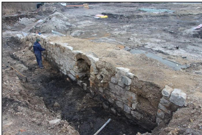
Arkæologer i færd med udgravning af resterne af stampemøllen

Skrevet af Niels Nørgaard Nielsen med afsæt i Hans Gjedsted bog ”... et lille bidrag til Støvrings Historie”.