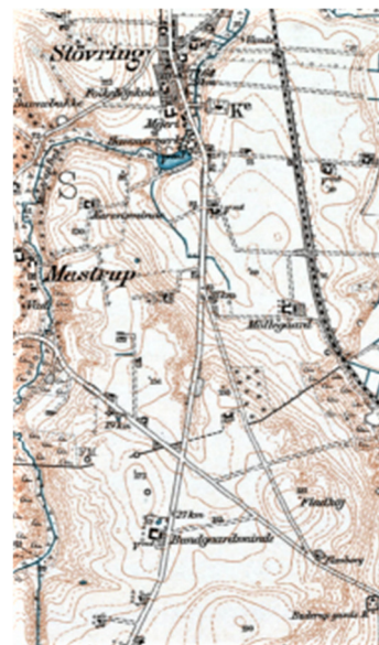
Figur 1Rebild Kortinfo. Lave målebordsblade 1901 1971