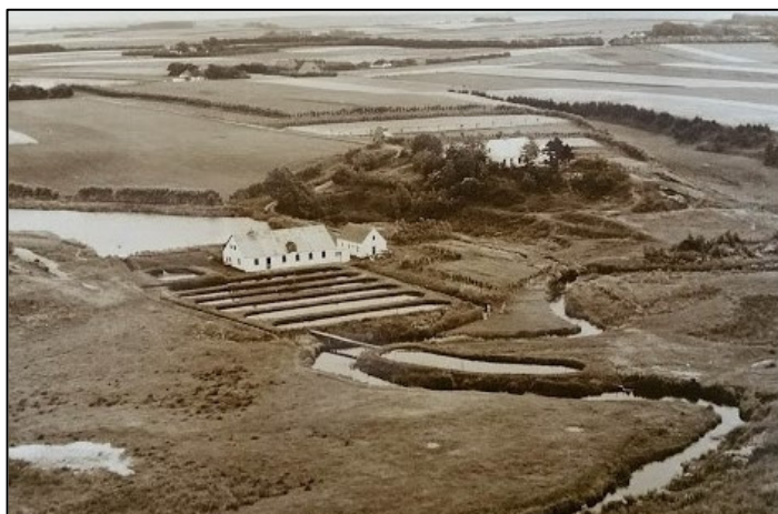
Rebstrup Uldspinderi med de i 1954 anlagte fiske-damme, foto 1957

Indtil midten af 1900-tallet var der to vandmøller i Rebstrup, den øvre og den nedre. Dette skrift handler om Rebstrup Nedre Mølle. Lokalkendte kender stedet som Rebstrup Uldspinderi eller blot "Spinderiet". Dette gælder nok især den ældste generation. Lidt yngre kender måske stedet som dambruget Rebstrup Damkultur.