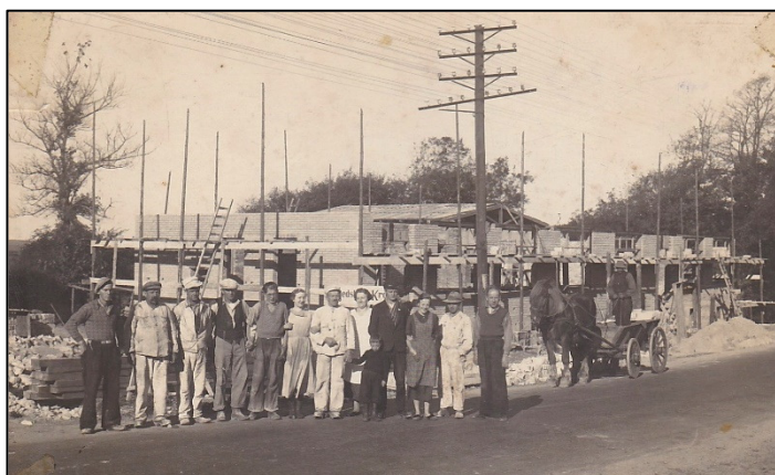
Kræn Masen var murermester på byggeriet af Hjedsbæk Kro i 1937 og står som nr. 2 fra venstre. Nr. 1 fra venstre er sønnen Dusingus og nr. 5 fra venstre er sønnen Aage, 17 år og senere ejer af uldspinderiet.

I 1926 gav Jens Jensen op og solgte uldspinderiet, men beholdt resten af ejendommen matr. 1g, idet selve uldspinderiet og jorden omkring bygningen blev fraskilt med eget matrikelnummer -1h.