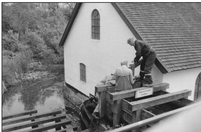
Rebstrup Uldspinderi opstillet i Raadvad

Omkring 1987 var opgaven fuldført, og tanken var, at den gamle uldspinder nu skulle oplære personale fra Nationalmuseet i brug og ikke mindst vedligehold af de gamle maskiner, men det skete ikke. Igen var der blevet prioritet anderledes. Bygningen forfaldt. Det dyre nybyggede vandhjul rådne, fordi der ikke blev kørt med det, og til sidst blev maskinerne taget ned og lagt i magasin - igen. Efter flere indbrud og hærværk er bygningen nu revet ned. Aage døde i 2003 og oplevede ikke dette.