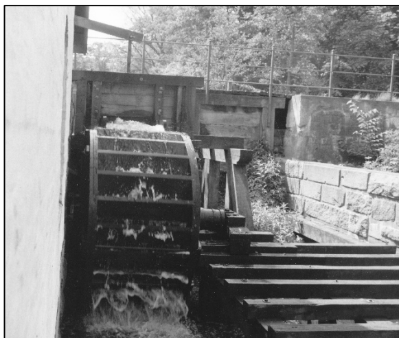
Vandhjulet på Rebstrup Uldspinderi opstillet i Raadvad