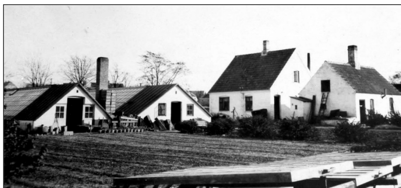
Gartneriet med drivhuse, mistbænke, friland og beboelse

Nå, mens jeg skriver dette, mere end fyrre år efter, så er jeg ikke i tvivl om, at det valg jeg traf hin forårsdag for så mange år siden var det rigtige. I modsat fald ville jeg måske ikke i dag have oplevet at komme til at kende og have haft med så mange mennesker at gøre, både syge og raske, som tilfældet er.