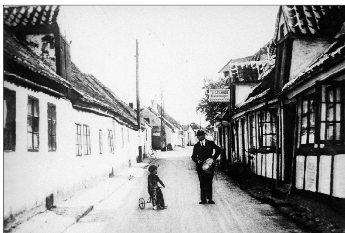
Trommeslageren i en af Nibes smalle gader

De fleste byer og egne har hver sine særprægede mennesker. Nogen mere end andre, men fælles for dem alle er, at de på en eller anden måde bemærker sig mere end andre. Lige som min hjemegn har sine, så havde Nibe også den gang nogle af slagsen.