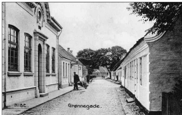
Teknisk Skole i Grønnegade

I efterårets skumring blev en af os somme tider sendt af sted med en trækvogn til kirkegårdens affaldsgrube, hvor vi samlede alle de bortkastede krans sammen og kørte dem hjem i gartneriet. På regnvejrskage og mørke aftener, hvor vi ikke kunne lave andet, blev vi sat til at afmontere kransene, så bøjlerne kunne anvendes til nyt binderi ind mod jul. Grunden til at denne transport skulle foregå i aftenskumringen var, at kunderne ikke måtte se, at dele af de købte krans havde tidligere været brugt.