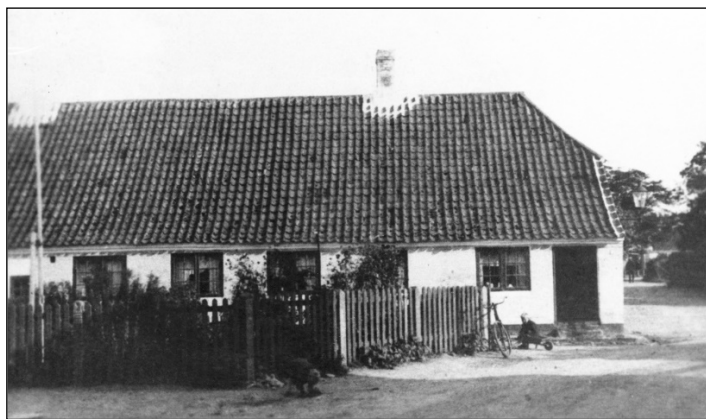
Nibe Fattig- og Svendehjem