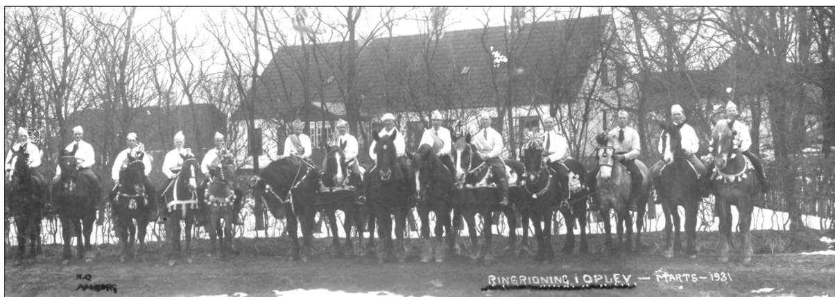
Ringridning i Oplev, marts 1931

Livet i sådan en landsby kan godt virke lidt ensformigt og dødt på os i dag, men når jeg ser tilbage på min barndom og mindes jeg ikke, at vi døjede med at få tiden til at gå, skønt vi ikke havde meget legetøj. Men vi fandt altid sten og pinde og andet, som vi i fantasien kaldte grise,