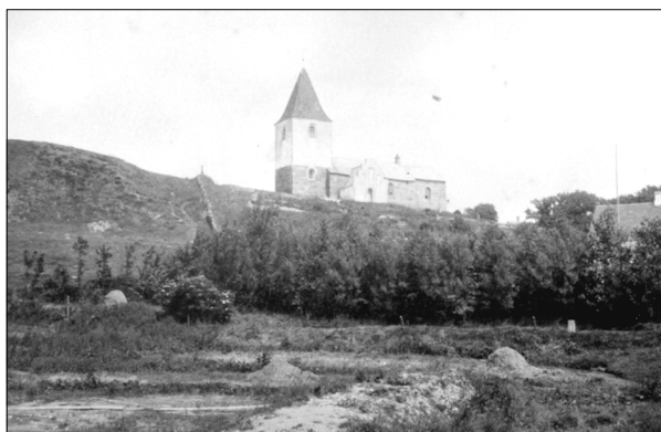
Gravlev Kirke med Klokkakken til venstre