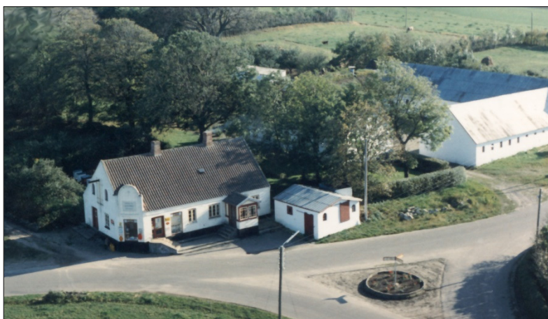
Bradsted Brugs blev omdannet til købmandsbutik, der fungerede helt frem til omkring 1980