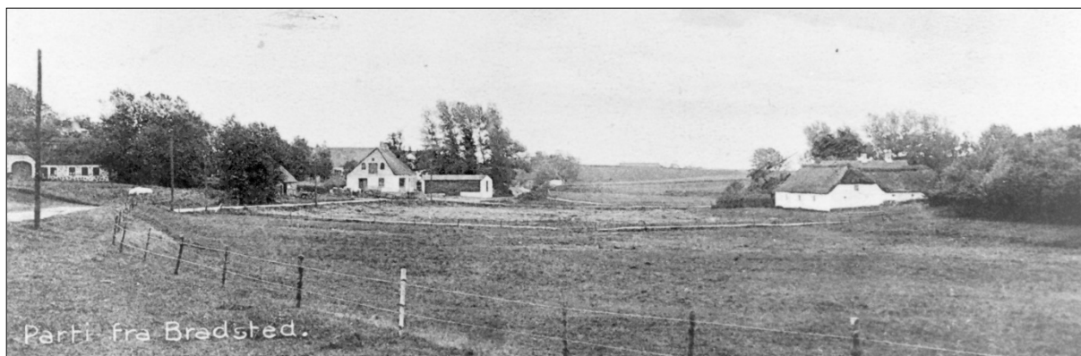
Det var på gården til højre i billedet Brugsen i første omgang fik sine lokaler. Senere byggede man sin egen bygning, som ses i midten af billedet

Foreningens overskud blev, efter hensættelse til en reservefond, udbetalt til medlemmerne i forhold til det købte, det der senere betegnedes som dividende.