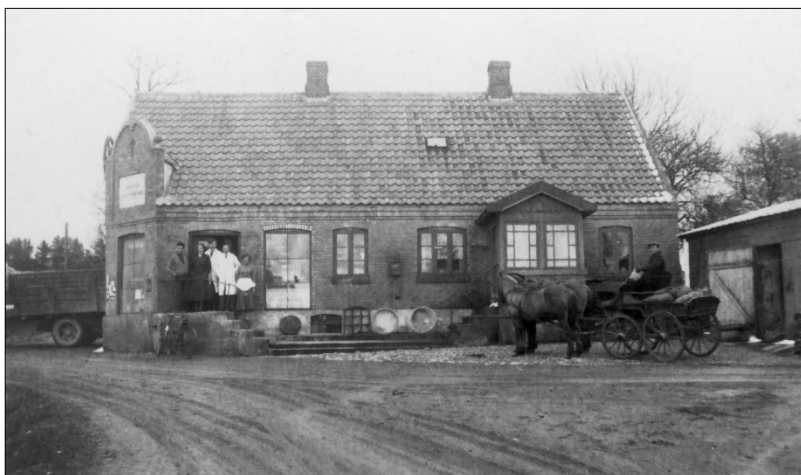
Bradsted Brugs omkring 1930

generalforsamlinger i Bradsted Skole, foregik de nu i Hjeds Forsamlingshus beliggende i Kirke-terp. At priser og regnskabstal er væsentlig højere end før er en selvfølge.