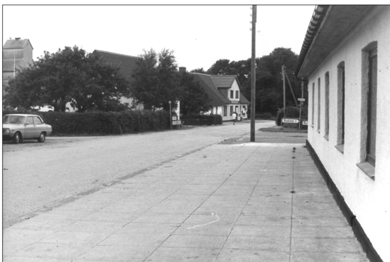
Brugsen i Kirketerp kom til at ligge tæt ved Forsamlingshuset

Tankerne fra 1934 om bedre forhold for butikken kom igen op i januar 1941. Der var forslag om at købe noget af nabogrunden til en udvidelse. Forslaget blev nedstemt på generalforsamlingen i februar. Allerede i marts fremkom forslag om at oprette en filial ved Kirketerp. Den ekstraordinære generalforsamling i april ville gå endnu videre, for her blev det direkte vedtaget at flytte Bradsted Brugsforening til Kirketerp, og at den samlede bestyrelse skulle være byggeudvalg. Byggeri blev der dog ikke så meget af i første omgang, for allerede i slutningen af måneden besluttede bestyrelsen at købe ”den i Kirketerp beliggende forretningsejendom” for 15.500 kroner. Der var dog to bestyrelsesmedlemmer der modsatte sig denne disposition ”på grund af de for tiden herskende forhold”. Straks efter var der 56 medlemmer af Brugsforeningen, der anmodede om en forhandling med bestyrelsen, idet de i protest mod beslutningen om at flytte forretningen ønskede at udmelde sig. Et flertal i bestyrelsen ønskede ikke nogen forhandling, men arbejdede ufortrødent videre med planerne, og straks derefter henvendte de sig til FDB’s arkitektkontor om bistand til udformning af en tilbygning i form af et pakhuis til den købte ejendom.