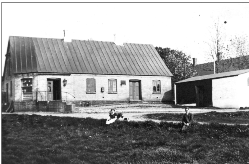
Bradsted Brugs nogle år efter ejendommen var opført

Der var, inden den endelige beslutning blev truffet om at bygge helt nyt, også et forslag fremme om at bygge 2 ekstra fag á 3 alen til den eksisterende lejede bygning. Hvis det var denne løsning der skulle gennemføres, var det for ejerens regning og Brugsens ville så indgå en lejeaftale for en periode på mindst seks år.