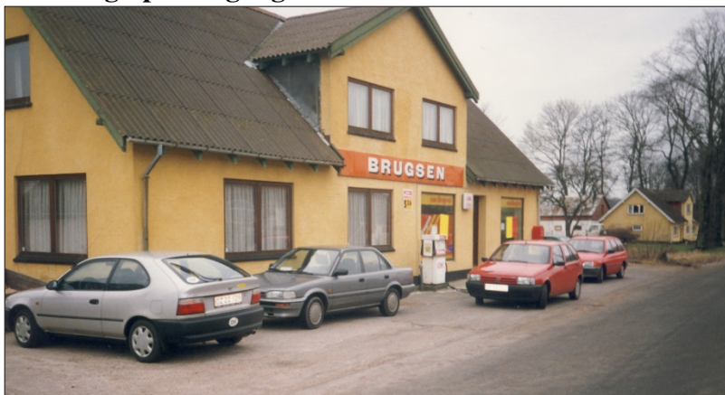
Brugsen i Kirketerp, da det lakkede mod enden

1968 var året, hvor der for første gang noteredes nedgang i omsætning af dagligvarer – en generel tendens for brugsforeninger i landområder, som det blev bemærket. Måske som en konsekvens af dette blev der taget beslutning om en større modernisering af butikken. Det viste sig dog at nedgangen i omsætningen i 1968 var en enlig svale, idet der i de følgende år igen år for år kunne konstateres stigende omsætning på alle områder.