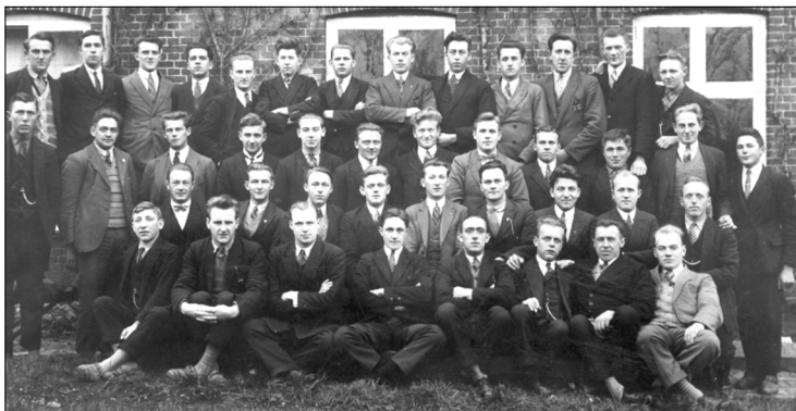
Uddelerskolens hold på Støvring Højskole 1930

Selvom krisen for alvor begyndte at kradse i begyndelsen af 1930'erne, ser det dog ud til at gå ganske godt for Bradsted Brugsforening. Der blev således normalt betalt overskud på 12 % til medlemmerne samtidig med at de fik udleveret gratis kalendere, og at Brugsforeningsbladet blev tilsendt hver enkelt medlem. Lukketiderne blev indskrænket, således at der nu blev lukket klokken 12 juleaftensdag og i dagene mellem jul og nytår. Dog ses det lidt ildevarslende at på hvert bestyrelsesmøde blev det gennemgået hvor store udestående uddeleren havde fra kunder. Disse udeståender må først og fremmest være på videresalget af grovvarer fra Støvring Lokalforening til landmændene. En økonomisk belastning var det, at benzinprisen steg, så vognmandstaksten blev hævet betragteligt. Et andet krisetegn kan ses af vedholdende forslag om at nedsætte lønnen til formanden, kassereren og revisoren. På en generalforsamling i sommeren 1932 blev det vedtaget at nedsætte lønningerne med 25 %.