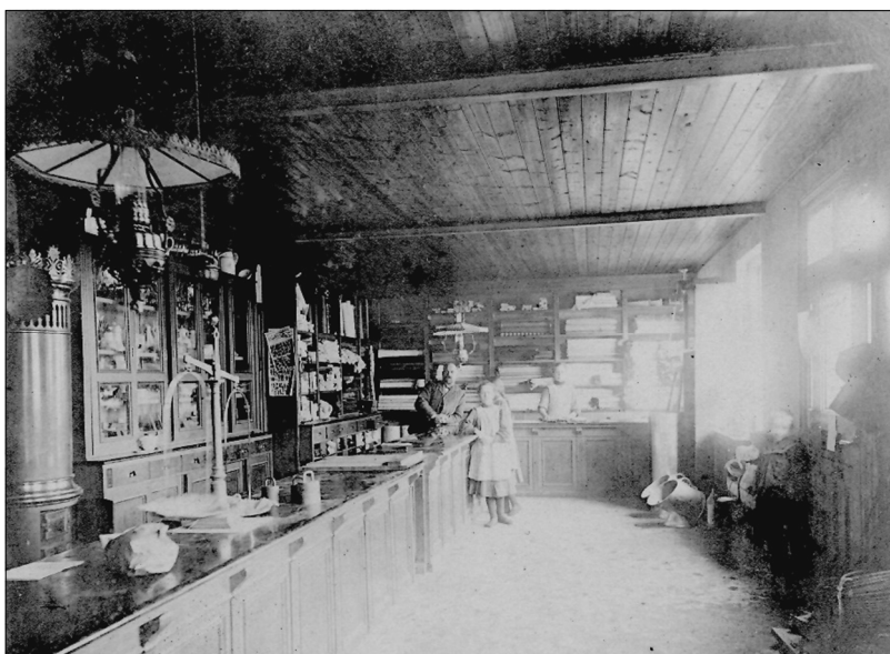
Inventar i Brugsen i Øster Hornum – man må regne med at indretningen i Bradsted har lignet temmelig meget