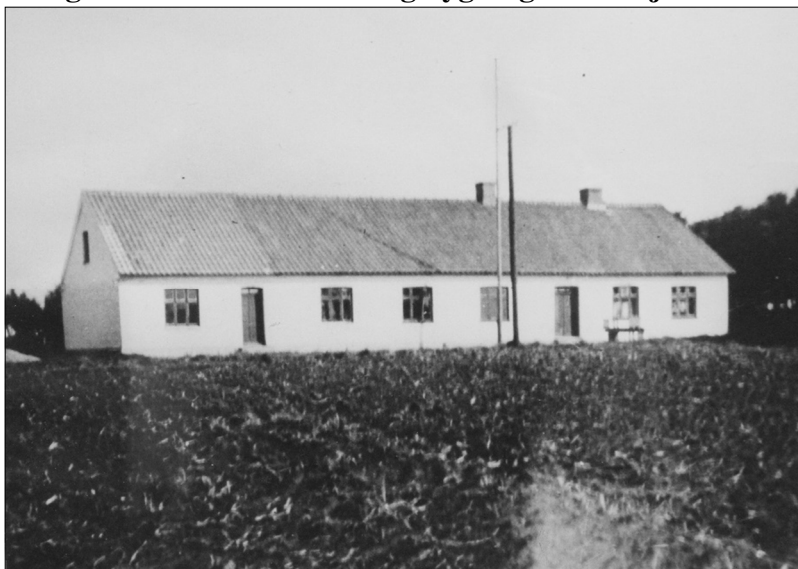
Hjeds Forsamlingshus i Kirketerp omkring 1925

Det stod efterhånden klart, at butikkens rammer var ved at være for små til den efterhånden store omsætning af navnlig grovvarer. Derfor kom der forslag om enten at købe noget jord af naboen og her udvide virksomheden eller helt at flytte den hen til Hjeds Forsamlingshus beliggende i Kirketerp. På den baggrund undersøgte man priser for jord dels i Bradsted, dels ved forsamlingshuset, dels andetsteds i Kirketerp. For at søge inspiration til en eventuel nybygning tog bestyrelsen på tur til Sebbesund for at se den der