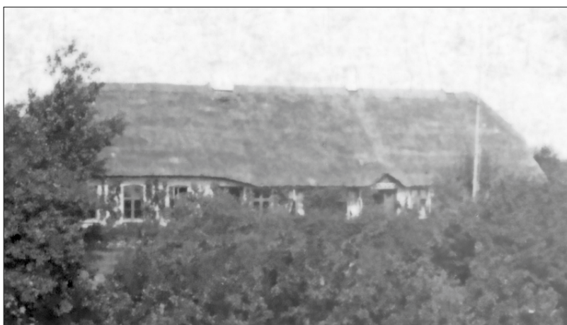
Veggerby Skole 1904

I 1880'erne blev der overalt i Danmark oprettet et utal af foreninger og andelsselskaber med vidt forskellige formål. Nogle politiske, andre kulturelle og endelig en række med helt praktiske formål såsom andelsmejerier og andelsslagterier og navnlig brugsforeninger i nær sagt hver eneste landsby med respekt for sig selv. Således også i vores område, hvor Støvring som den første fik sin brugsforening i 1888, Bradsted i februar 1889 og Øster Hornum i sommeren 1889. Bradsted var med andre ord en af de første landsbyer her omkring, der fik sin egen brugsforening. Det er denne brugsforening denne artikel handler om.