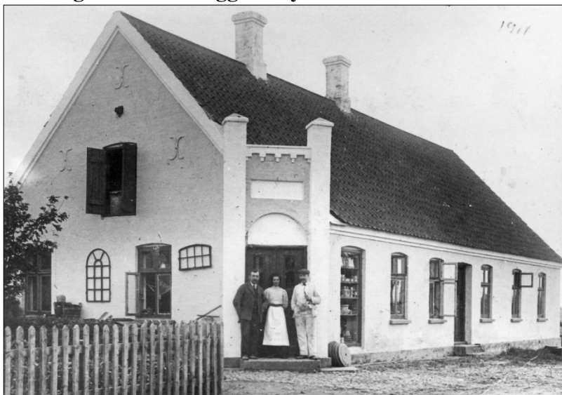
Den nybyggede Brugsforening i Byrsted

sporene fra Bradsted Brugsforening i og med at man snart tilsluttede sig Fællesforeningen for Danske Brugsforeninger. Det ses yderligere at nogle, der i årevis havde været bestyrelsesmedlemmer i Bradsted, nu figurerede som medlemmer af bestyrelsen i Byrsted.