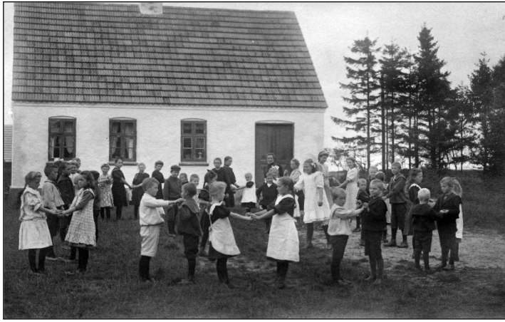
Ottoline ser til, mens børnene leger på legepladsen

os alle, selv de mest skarnsagtige, omtalte hun som en gæv dreng eller pige.