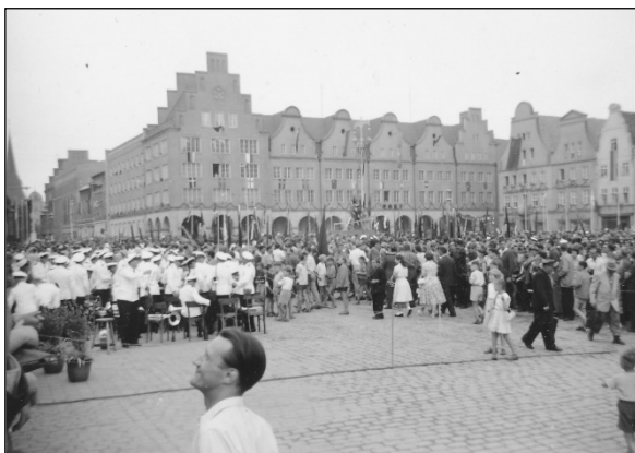
"40.000 mennesker samlet"