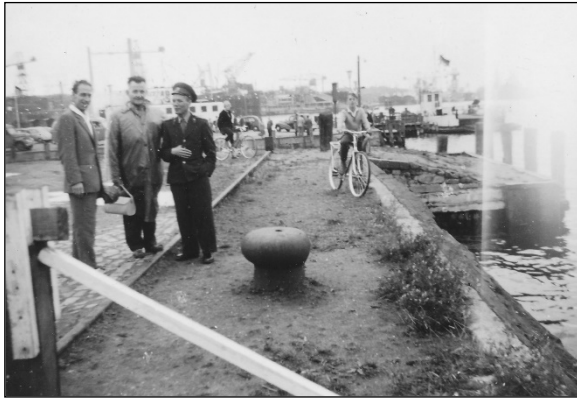
"Den eneste russiske soldat vi så - han var fra Berlins Radio"