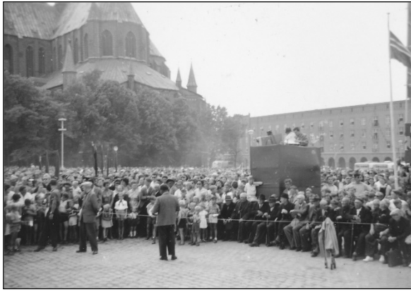
"Den store folkefest i Rostock søndag d. 27. juni 1959. Marienkirken i baggrunden"