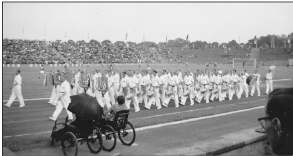
"Musikken rykker ind inden Leningrad og Rostock spiller fodbold - invalide på første parket"