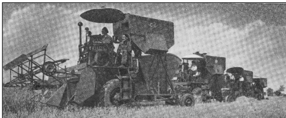
"Der høstes - hver kollektiv bonde har sit eget hus"