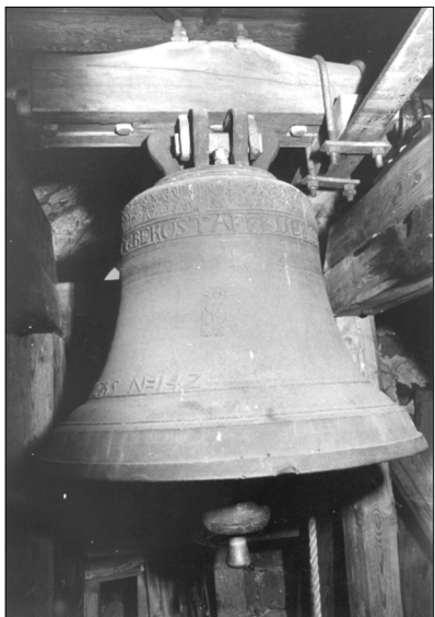
Klokken i Gravlev kirke