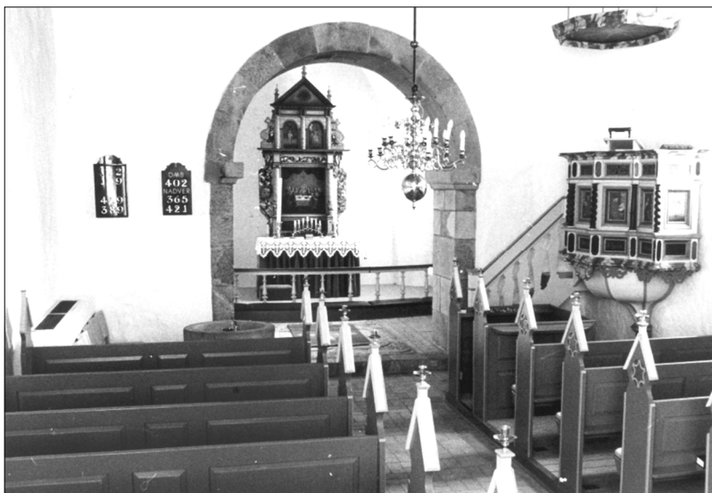
Nutidigt billede af Gravlev kirkes indre

nighedsrådet ret længe, før der kom elektrisk lys i kirken og vi fik også egne stole. Om de så var mere egnede ved jeg såmænd ikke, for de andre var sandelig da pæne.