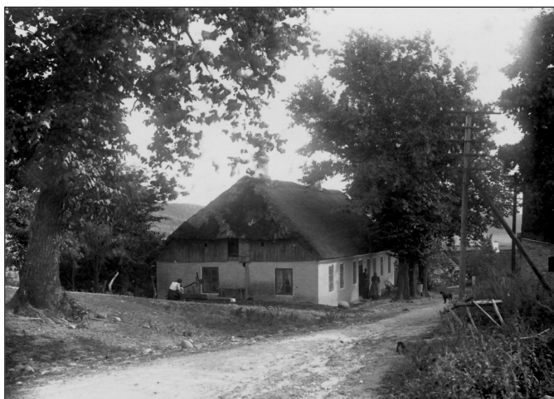
Skolen, der blev bygget 1830 og fungerede til 1913