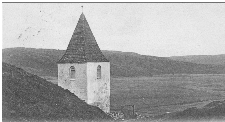
Gravlev Kirke omkring år 1900 set fra bakken bag kirken

Skrevet 1938 af Th. Johansen, lærer i Aarestrup