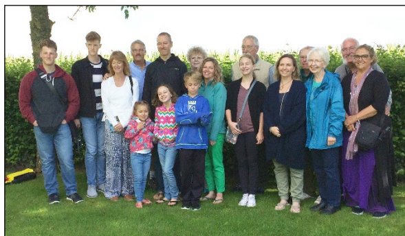
Den netop sammenbragte amerikanske familie

Det var sjovt for dem at gå rundt i huset og forholde sig til indretningen, i sammenhæng med erindringerne fra deres fars, farbrors og bedstemors historier om huset og familien i Danmark. Vi kunne supplere med detaljer fra diverse ombygninger, og om hvor vi havde fundet staldvinduer indmuret i væggene og terrazzogulv under gulvet og den slags, så vi lærte alle noget af den rundtur. Så var det blevet tid for kaffe, te, saftevand og brød til alle og en præsentationsrunde.