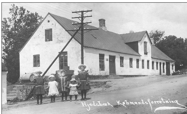
Hjedsbæk Købmandshandel kort efter år 1900