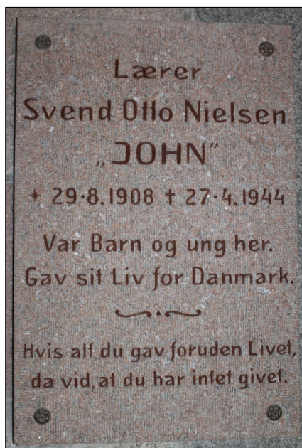
Mindetavlen i Aarestrup Kirkes våbenhus