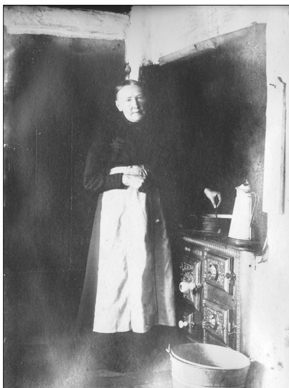
Kaffekanden står klar på brændselskomfuret

I slutningen af 1860'erne kom der store strukturændringer til Nordjylland, idet Den østjyske Længdebane fra Aalborg sydpå blev fuldført i 1869. I en del år havde der været vandrearbejdere, som vel ikke alle var svigermors drøm, på egnen, som har forurolet landbefolkningen, men også bragt omsætning for kro og marketenderi samt lejeindtægter.