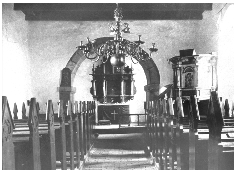
Buderup Kirkes indre, som den omtrent har set ud, da denne fortælling foregik