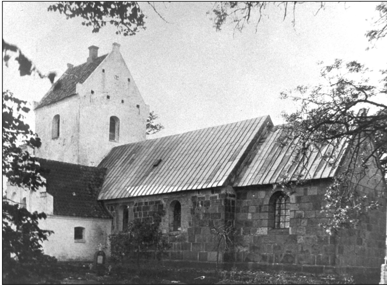
Buderup Kirke, som på daværende tidspunkt betjente Sørup, der lå syv kilometer væk - en strækning, der ofte blev tilbage-lagt til fods i al slags vejr

Landbefolkningen havde i sådanne situationer løst problemet på én og samme måde: En ny husbond måtte tage over, hvilket betød, at enken hurtigst muligt måtte gifte sig igen.