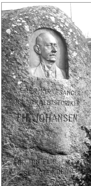
Mindesten sat ved Bydammen i Aarestrup