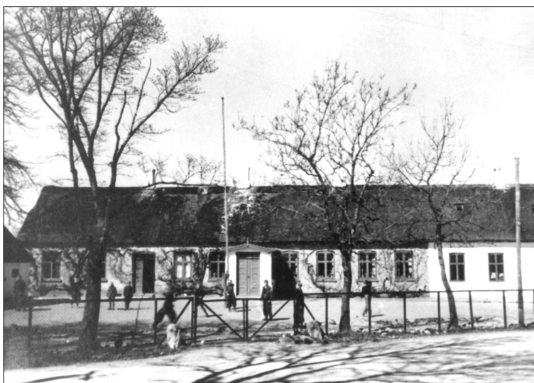
Aarestrup Skole cirka 1935