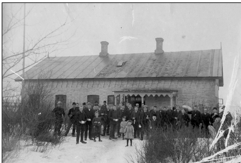
Støvring Højskole med lærere og elever kort efter indvielsen 1885